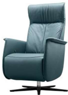
A: T-stiksel + arm 1