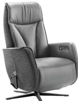
C: V-stiksel + arm 3