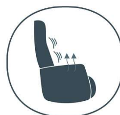
verschillende comfort systemen