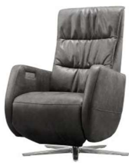
B: Baanstiksel + arm 2