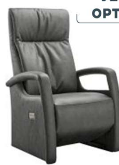
D: Trekstrook + arm 6 (doorlopend)