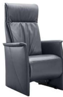
D: Trekstrook + arm 1 (doorlopend)