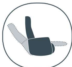
handmatige verstelling (gasveer)