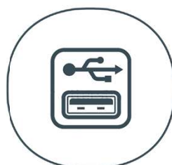
USB met ingebouwde bediening